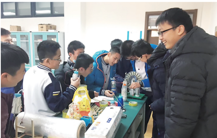
激发学生探索潜能。