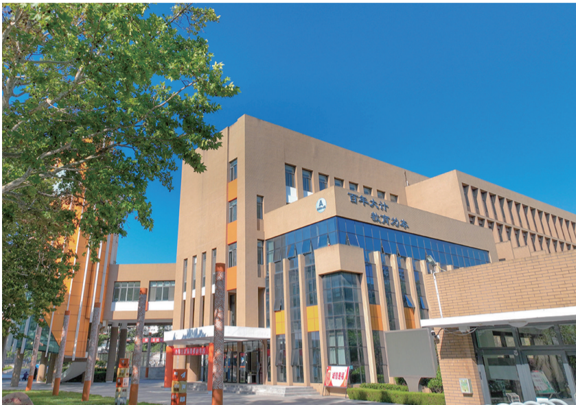
青岛二中分校优美的校园环境。