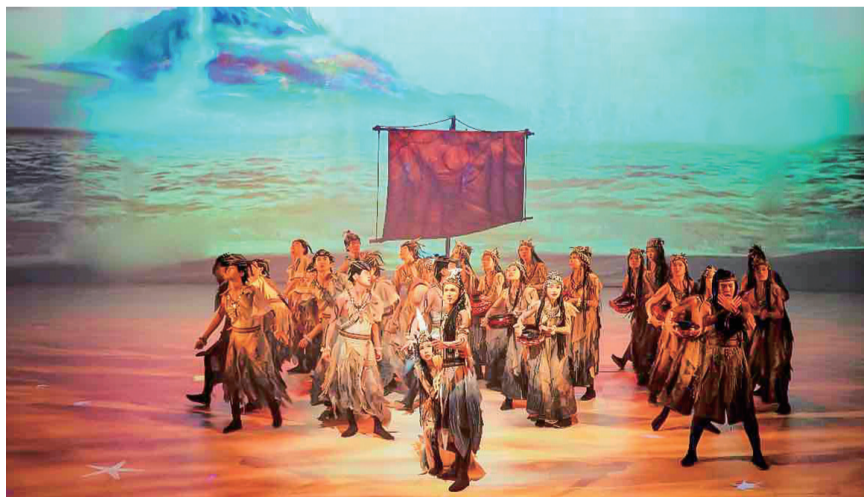
《寻梦沧海》剧照。

奥帆中心海上剧场为全息影像沉浸式剧场,270度沉浸式包裹影像构建全视域海洋,全景声环绕营造多维、逼真、