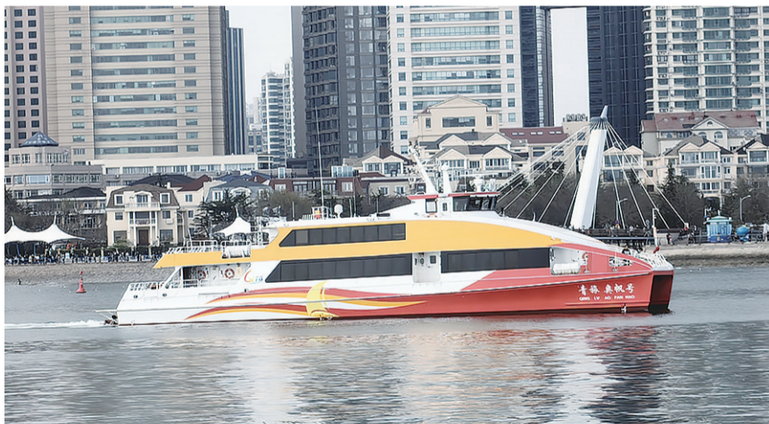
青岛旅游集团全新游轮“奥帆号”。

除此之外,为进一步满足旺季海上旅游市场需求,青岛旅游集团还将在2024年旺季前陆续入列各类船艇40余艘,广泛分布于各条航线,景区覆盖奥帆海洋文化旅游区、栈桥景