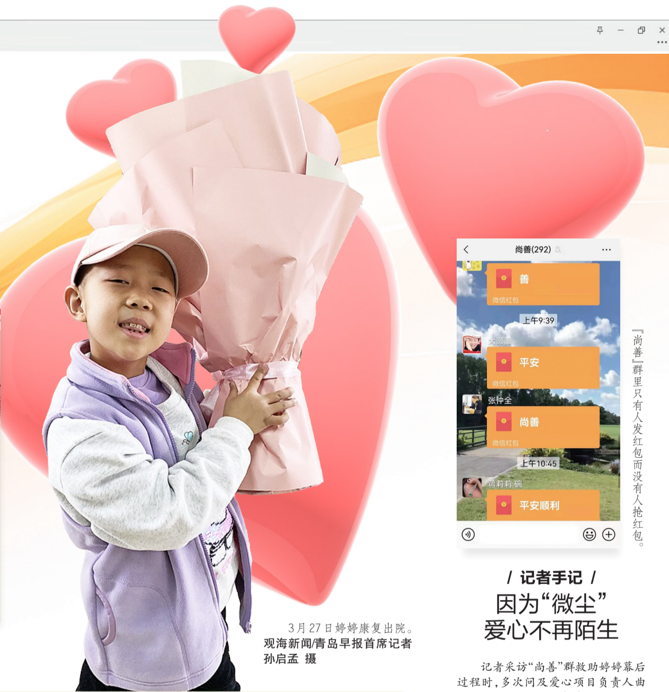
3月27日婷婷康复出院。