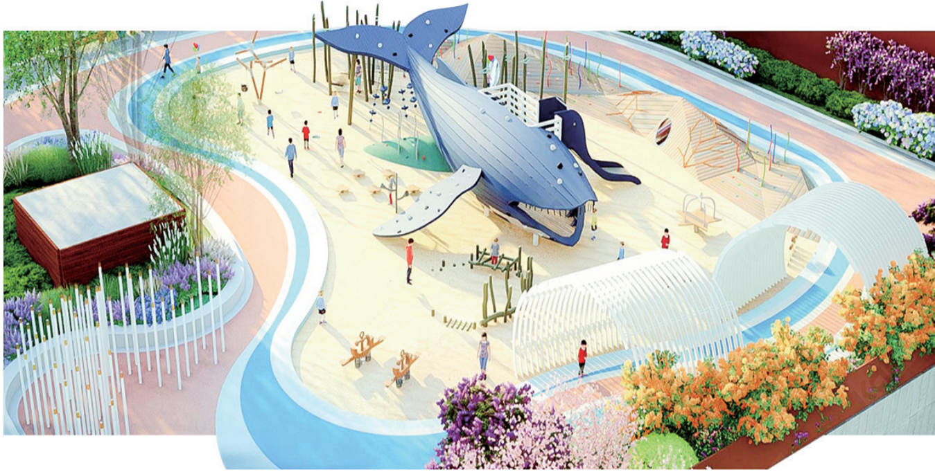
红树林“鲲鹏”儿童乐园项目效果图。

小巧精致的口袋公园,彰显的不仅是民生福祉,更是全面提升城区品质的生动实践。今年,西海岸新区将充分利用城区边角地等空间建设口袋公园,推