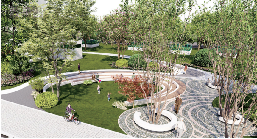
辛屯路站口袋公园项目效果图。