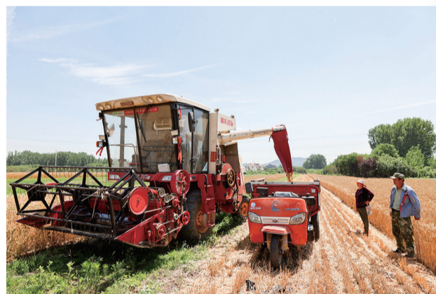
村民们欣喜地看着金黄的麦粒。