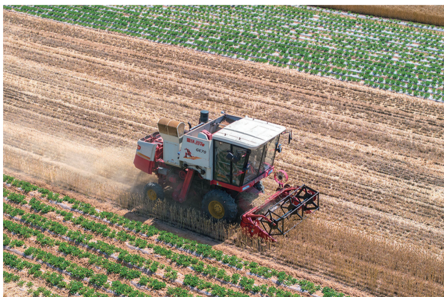
收割机在麦田轰鸣作业。