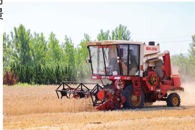
农机手驾驶着收割机抢收小麦。

据悉,青岛西海岸新区今年小麦播种面积35.05万亩,比去年增加3.72万亩,同比增长11.9%。目前,这些小麦已陆续进入成熟期,青岛西海岸新区正组织农户抢收已经成熟的小麦,确保夏粮满仓。