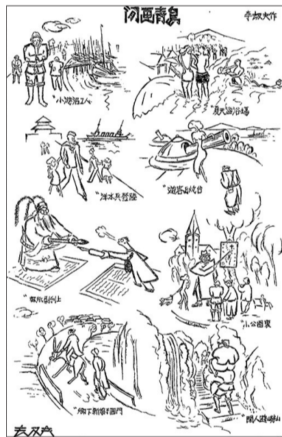
闲画青岛(发表于《论语》杂志1935年76期)。