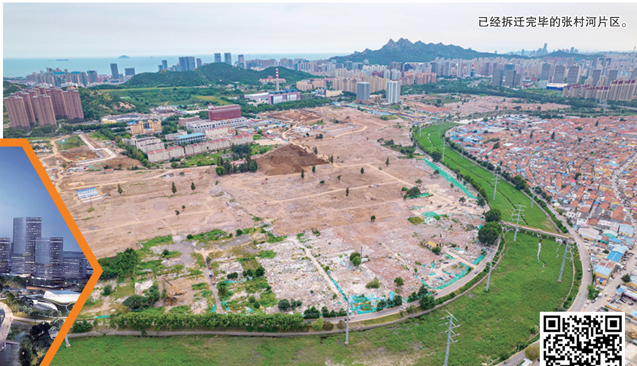
已经拆迁完毕的张村河片区。

张村河片区,曾是全市最大的“城中村”,如今正华丽转身,未来将成为青岛东部的生态之城、希望之城、未来之城。5月31日,崂山区自然资源局正式发布《青岛市崂山区张村河片区城市设计方案征集公告》,青岛市面向国际征集最具创意、最能体现青岛特色和崂山形象又兼具落地实施性的城市设计方案。