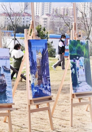
启动仪式上的多种精彩活动。