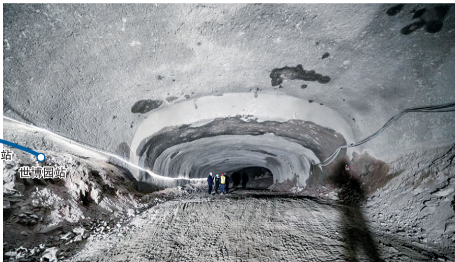
龙川路站施工斜井。

11月24日,青岛地铁2号线二期龙川路站进入主体开挖施工,这是青岛地铁三期建设中首座进入主体开挖施工的暗挖车站。