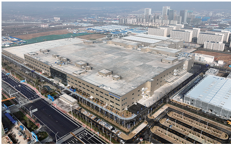
青岛京东方光电科技有限公司。

25日,青岛京东方光电科技有限公司产品点亮暨量产仪式在青岛西海岸新区举行。该项目产品点亮同时实现规模化量产,是青岛市“强芯扩屏”的一个重要里程碑,为青岛新一代信息技术产业集群发展注入了强劲动能,彻底打破山东显示领域缺少龙头项目支撑的局面。