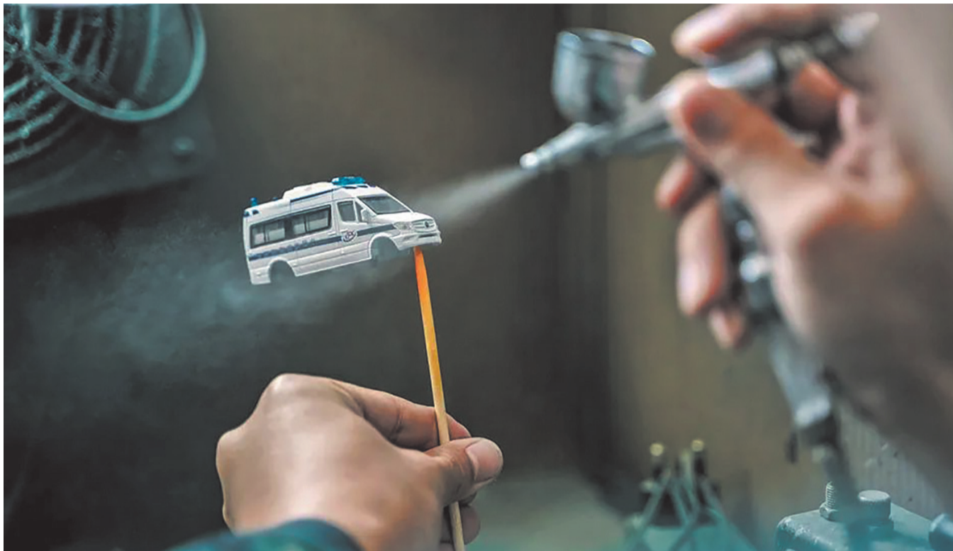
喷漆是模型制作的重要环节。