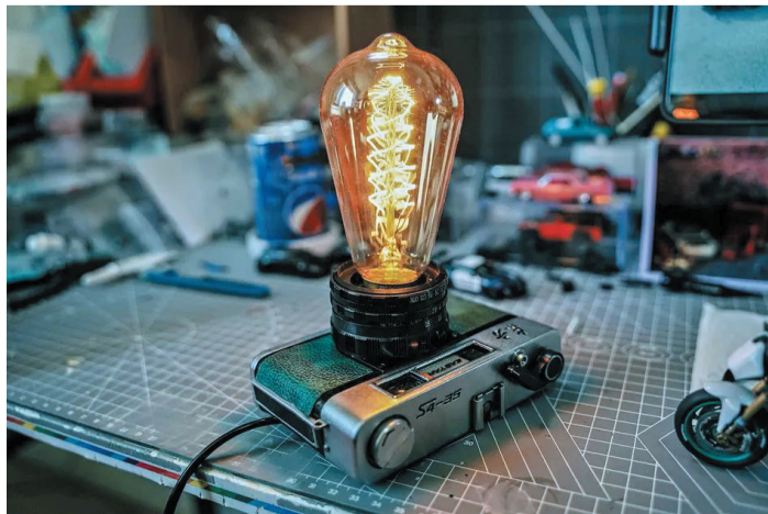
不仅是模型车,废弃的相机制作成台灯,朋克味十足。