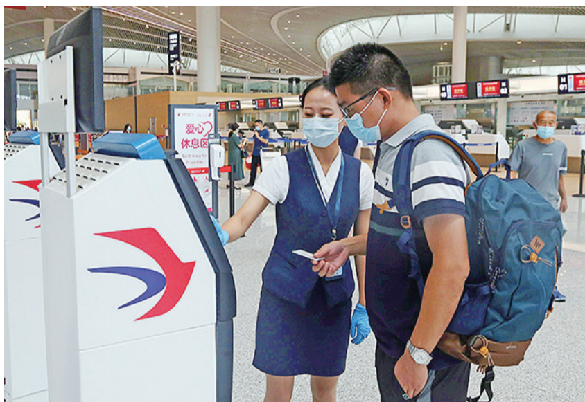
青岛胶东国际机场航站楼内地服人员为乘客服务。

8月12日,在山东省内首座4F级国际机场——青岛胶东国际机场迎来转场运营一周年之际,胶东机场转场一周年工作座谈会暨战略合作集中签约活动在君廷酒店举行,会上,围绕“服务‘上合’、融入‘一带一路’、助力打造国际门户枢纽城市”等5项主题,青岛机场集团分别与航空公司、交通运输单位、物流头部企业、产学研平台、专业研究机构签署战略合作协议。青岛机场集团对航司、货代公司等发布互利共赢优惠政策,联合驻场单位共同发布“一周年、更懂您”服务承诺。