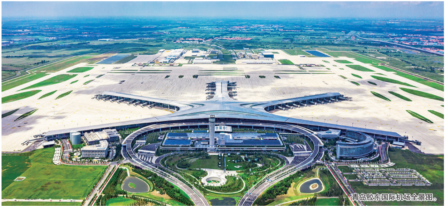
青岛胶东国际机场全景图。

时间是最忠实的记录者,也是最客观的见证者。一架架飞机起落之间,今天,青岛胶东国际机场转场运营已满一年。人物其行、货物其流的机场,成为带动城市经济发展的重要引擎,对吸引更多的全球资源要素集聚,在更大范围内形成辐射带动效应具有重要意义。一座新机场,“焕新”一座城。这座焕然一新的4F级机场,展开了青岛国际航空枢纽的“新翼”,“有温度、更懂你”的“四型机场”逐渐成为彰显青岛城市发展活力的网红地标,重塑着城市的交通、产业、空间等要素资源,为青岛更好承接国家叠加战略带来的发展机遇赋能蓄势。