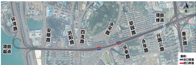
项目初步方案示意图。

8月11日,根据《青岛市重大行政决策程序规定》(市政府令271号)《青岛市重大行政决策风险评估办法》(青政办字[2018]127号)等文件的要求,青岛交通发展集团有限公司开展唐山路(环湾路—重庆路段)和(重庆路—天水路段)工程公众参与和风险评估工作。按照程序,现公示项目有关信息,征求公众对项目的意见和建议。本次公示主要就以下几点征求公众意见,如有其他方面意见或建议也可提出:1.您是否同意项目的建设;2.您认为项目建成后对当地经济及社会有何影响;3.您认为项目建设运营会对您的生活、工作带来何种影响;4.您对项目最关心的问题;5.其他意见和建议。