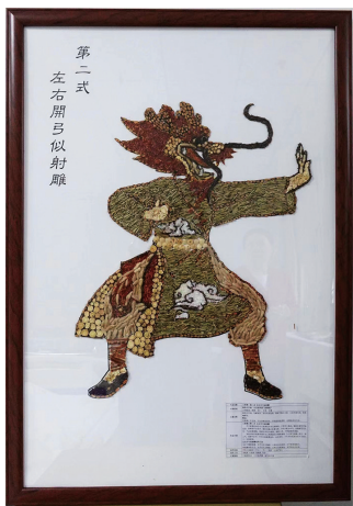
特等奖作品养生功法《八段锦》。