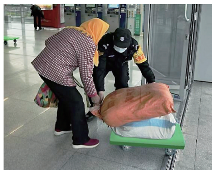
加速车为菜农提供方便。

本报5月8日讯 一个月前，青岛一趟地铁列车上上演了让全国网友“破防”的一幕——晚间的西海岸快线上，一位八旬老人推着卖菜车，手里拿着秤砣。“田间地头一年的耕作，几百斤地瓜吃不了，放在家里就烂了，太可惜……”87岁的他，从村里骑着电动车到董家口火车站地铁站，再坐地铁到井冈山路站附近卖菜，一趟就要两个小时。听了老人的叙述，车上乘客纷纷购买没卖完的菜品。因为老人没法接受网络支付，一些年轻人遗憾不能“帮衬”一把，发出了“以后出门记得带现金”的呼吁。老人卖菜时菜叶偶有掉落，有乘客悄悄收拾了起来，下车时带下了地铁。这一幕，充分体现了青岛这座城市的包容。