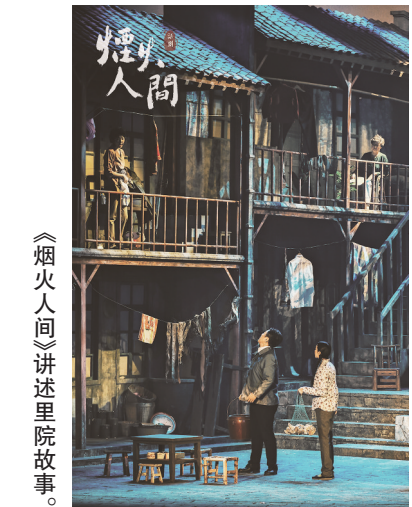
《烟火人间》讲述里院故事。

本报5月8日讯 清脆的铃声，打开水的吆喝声，街坊们相遇的打招呼声，孩子们玩游戏的笑声……热热闹闹拉开了话剧《烟火人间》的大幕，瞬间带领