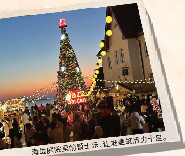
海边庭院里的爵士乐,让老建筑活力十足。