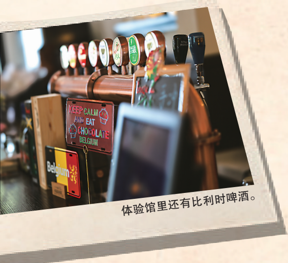
体验馆里还有比利时啤酒。