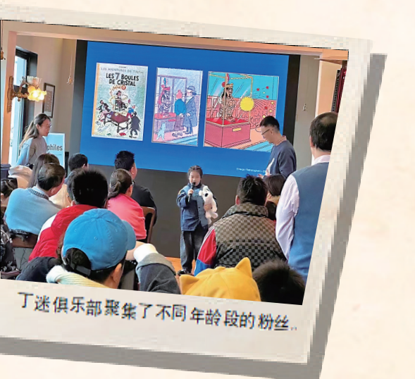
丁迷俱乐部聚集了不同年龄段的粉丝。