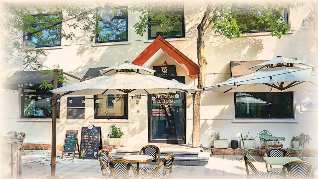
太平角一路21号,比利时驻青岛总领事馆旧址。

太平角一路21号的“今世”,是外地游客和本地市民都热衷打卡的比利时文化体验馆,这里有庭院里的爵士乐,有老楼里的比利时美食、美酒、巧克力和钻石,更有比利时著名动漫IP的集结点——中国北方第一家“丁迷俱乐部”正是在此,让《丁丁历险记》的粉丝可以一起欢聚。