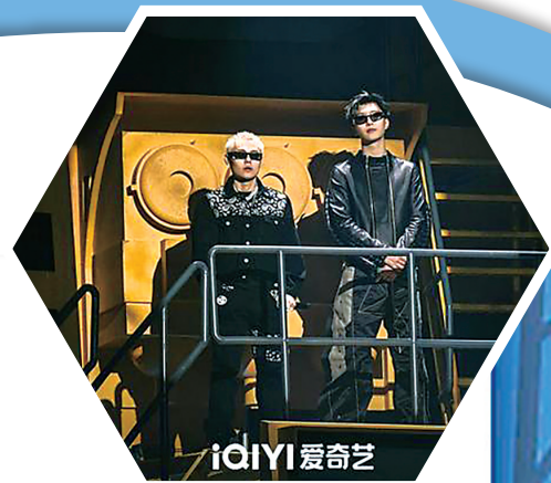
范丞丞搭档谢帝亮相《新说唱2024》。