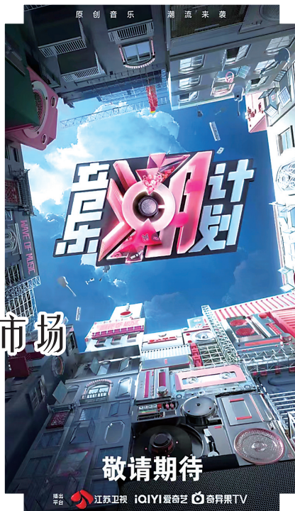
《音乐潮计划》携手人工智能角逐音乐创作。