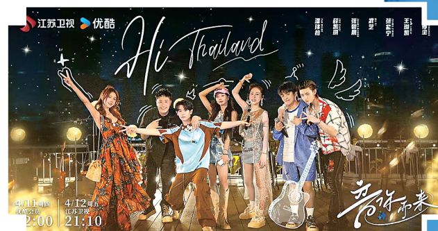
歌手组成旅游“搭子”《音你而来》。