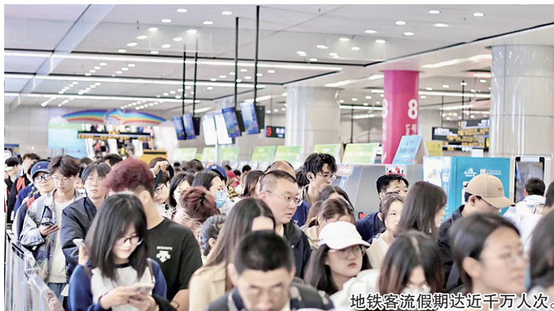
地铁客流假期达近千万人次。

青岛地铁为何成顶流？分析认为，一方面是青岛这座城市吸引力越来越强，越来越多的游客选择青岛出游；另一方面，越来越便捷的地铁线网让游客能够更顺畅地出行，也使更多人在出游时选择乘坐地铁。地铁与城市的双向奔赴，合奏出了一曲春天的交响乐。