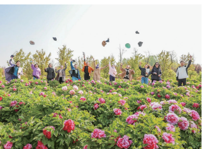
牡丹园吸引游客前来打卡。

本报5月5日讯 五一期间,莱西市河头店镇龙泉云堤牡丹园里,40亩牡丹进入最佳观赏期,30多个品种的2000株牡丹花竞相绽放,游客们在花海中徜徉流连,拍照打卡,定格春日美好。