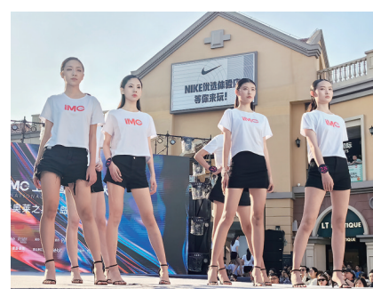
在青岛百联奥特莱斯举办的模特大赛。

这个五一假期,在即墨区,市民游客或是走进公园风景区游玩,或是走进农村体验田园风光,还有人走进商场,在T台前领略时尚。