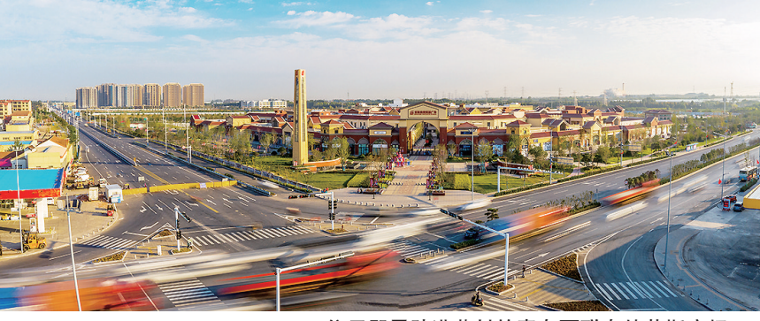
位于即墨陆港蓝村的青岛百联奥特莱斯广场。

本报4月23日讯 23日，在即墨陆港蓝村的青岛百联奥特莱斯广场，备受瞩目的著名轻奢品牌Coach(蔻驰)门店已进入装修最后冲刺阶段，不少装修工人正在进行硬装修收尾工作，今年“五一”假期将正式开门纳客。