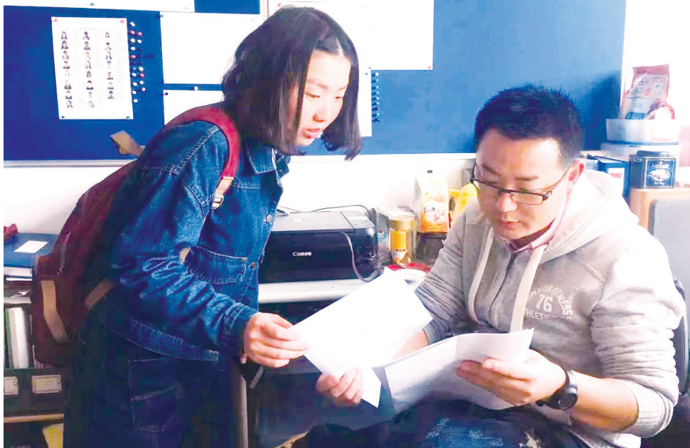
同学们遇到困难经常首先想到找“龙哥”帮忙。

欢迎提供人物线索 爆料电话：82860085 也可通过“青岛晚报官微” 公众号提交线索