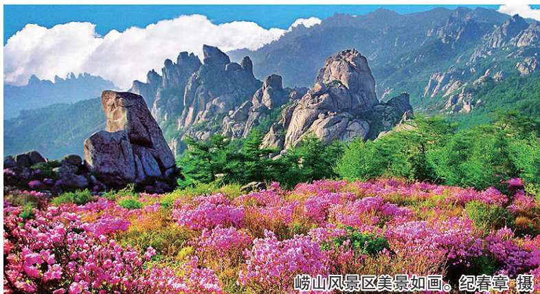
崂山风景区美景如画。

当天上午,“登峰望远·上春山”登山活动,将在巨峰天地淳和广场至灵旗峰开展;“手写崂山·春有约”春日寄语征集活动,将在巨峰天地淳和广场开展,现场设置9个“春和景明”打卡点;“山海雅集·逛春天”非遗宝藏市集,将在巨峰天地淳和广场开展,现场展示崂山春茶、掐丝珐琅等非遗技艺、民俗特产,邀请游客现场沉浸式体验非遗技艺;“太清仙境·春满园”百人太极表演将在太清广场开展,邀请游客近距离感受传统文化、太极文化;