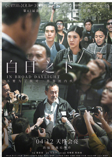
《白日之下》是本届金像奖演员类奖项的大赢家。