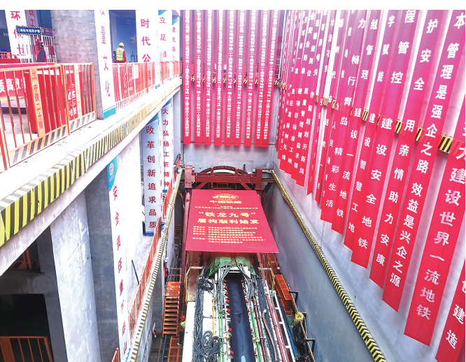
地铁15号线一期工程“铁龙9号”盾构机始发。

本报4月15日讯 15日，青岛地铁15号线一期工程南万站至四方厂站区间（以下简称“南四区间”）左线“铁龙9号”盾构机顺利始发。