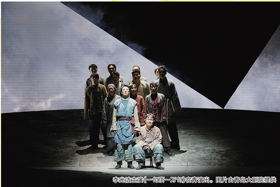
李光洁主演《一句顶一万句》在青演出。

上周末，《一句顶一万句》在青岛大剧院连演三场。主演李光洁接受记者采访时表示，每一位读者都会对刘震云的原著有不同的理解，他想塑造的杨百顺，可以面对磨难，仍然积极生活，“面对各种各样境遇变迁的时候，能够坚韧地继续活下来。”