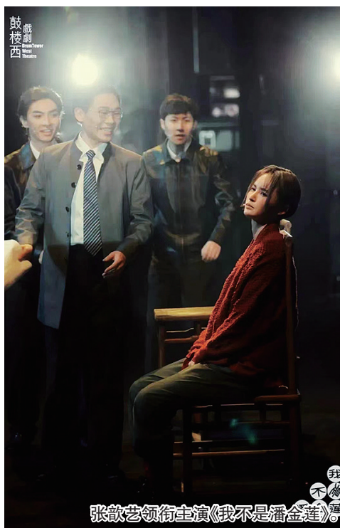
张歆艺领衔主演《我不是潘金莲》。