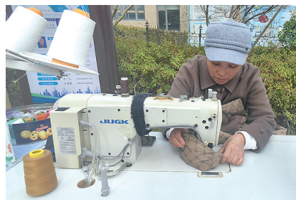
瑞源·名嘉汇便民生活圈内的便民裁缝铺。