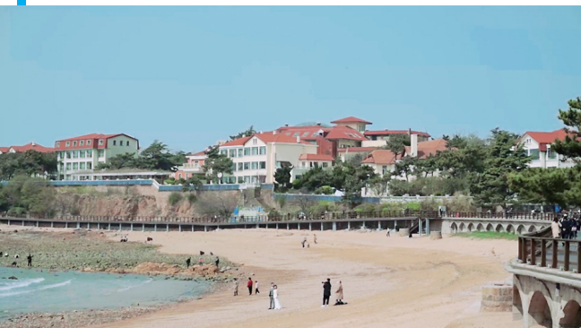
市南区以八大关太平角为先导打造文旅康养片区。

在城区游走,触摸城市肌理;在历史建筑中穿行,感受文脉印迹;在山海间徜徉,享受闲适惬意……作为新的经济增长点,文旅康养相关业态正在迅速崛起,持续激发消费新动能。为加快“十四五”期间文化、旅游与康养产业融合发展,激发区域发展的内生动力,近年来,市南区提出大力发展文旅康养产业,借势荣获山东省文旅康养强县东风,充分整合辖区优质康养