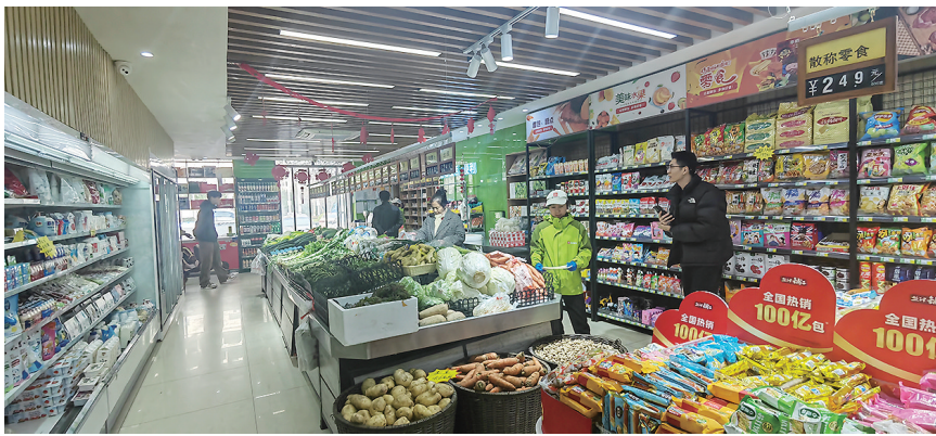
瑞源·名嘉汇一刻钟便民生活圈内的便利店。

“一刻钟便民生活圈”并非“千圈一面”。上流佳苑社区在“便民生活圈”功能已完善的基础上,不断优化提升,成立了上流便民服务社,还依托集体经济自持商铺打造上流佳苑“幸福街”,对居民服务、商业业态进行全新的整合布局,已经形成医疗门诊、课后托管、茶室酒馆、便民银行、快餐烘焙等业态全覆盖,居民不出社区就能一站式购齐生活物资、享受各项便民服务,让群众获得感、幸福感在家门口“升级”。