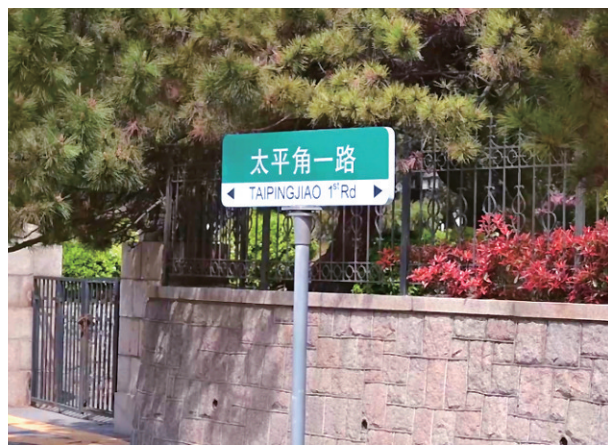
春日的太平角生机盎然。