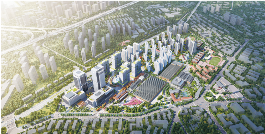
中车四方智汇港项目效果图。

在青岛市城市更新和城市建设三年攻坚行动中,老四方机厂作为青岛首个以科技产业为导向的城市更新项目,自2020年开始便拉开了更新的大幕,给低效片区的崛起“打样”。老四方机厂从新与旧的单向交融,用时三年培育出了传承与发展的新文化生态圈。当市民再次进入杭州路16号,镌刻城市历史的厂房肌理犹在,经城市更新注入的活力像是悦动的音符,让人们不禁感叹——“老四方机厂变了”。其实,变化远不止外在的形象,让老建筑“活化”的