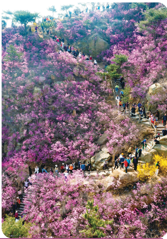
► 每年大珠山上的杜鹃花开,都会吸引游客前去登山赏花。(资料图)

进入3月,位于青岛西海岸新区的大珠山景区总是备受期待,万亩杜鹃花绽放之时便是青岛春日里最美的时刻。3月25日,记者从新区获悉,根据新区气象局预测,3月30日,景区内的万亩杜鹃花将进入赏花期。