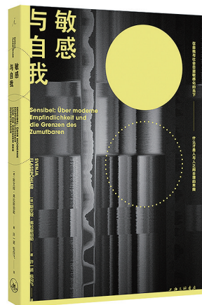
[德]斯文娅·弗拉斯珀勒 著 许一诺 包向飞 译 上海三联书店 2023年4月出版

身为领军级的神经科医生，作者借职业经历中所遇所闻的疑难病例，为我们展示了人类感官方方面面的机制及其构成的、联系着的奇妙世界，这里不仅有曼彻斯特的音乐、中东的食物和咖啡、斐济东星斑的鲜美和潜藏危险——这里栖居着我们每一个人，也是我们每个人无意识的个性创作。