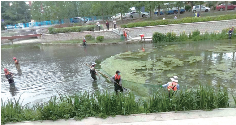
工人们在清理河道中的水草。

本报6月1日讯 水草是河道生态系统不可或缺的重要组成部分,但如果水草无节制生长,不仅会影响生态平衡,也会阻碍泄洪。为了维护好河畅、水清、岸绿、景美的水域环境,李沧市政公司在全区范围内启动汛前河道养护行动。