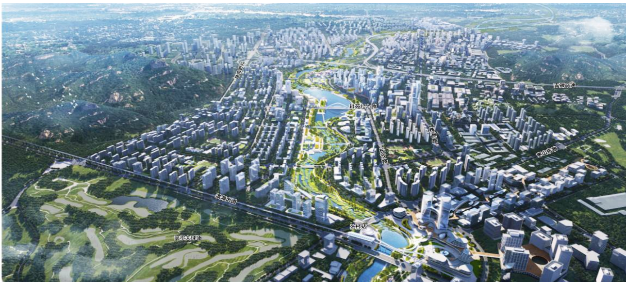
张村河片区效果图。

张村河两岸重点区域城市设计范围西至海尔路一跨海大桥连接线,东至枯桃社区一崂山余脉,总面积约7.6平方公里。设计机构应在张村河片区统筹设计基础上,对张村河两岸重点区域的功能布局、空间秩序、公共空间、城市风貌、景观环境及重要场景、重要建筑组团等进行精细化设计,方案设计内容深度整体达