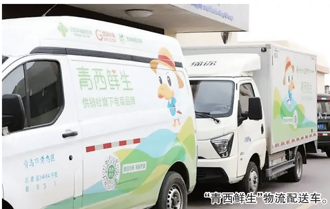
“青西鲜生”物流配送车。

西海岸新区供销社就是传统供销社体制改革的成功范本,2021年实现销售额43.4亿元,较改革之初增加4.3倍,拥有45家社有企业、13处基层供销社,资产总额21.66亿元,曾获全国“百强县级社”、全国供销社系统“金扁担”奖等荣誉,成为了供销社系统市场化改革的“优等生”。