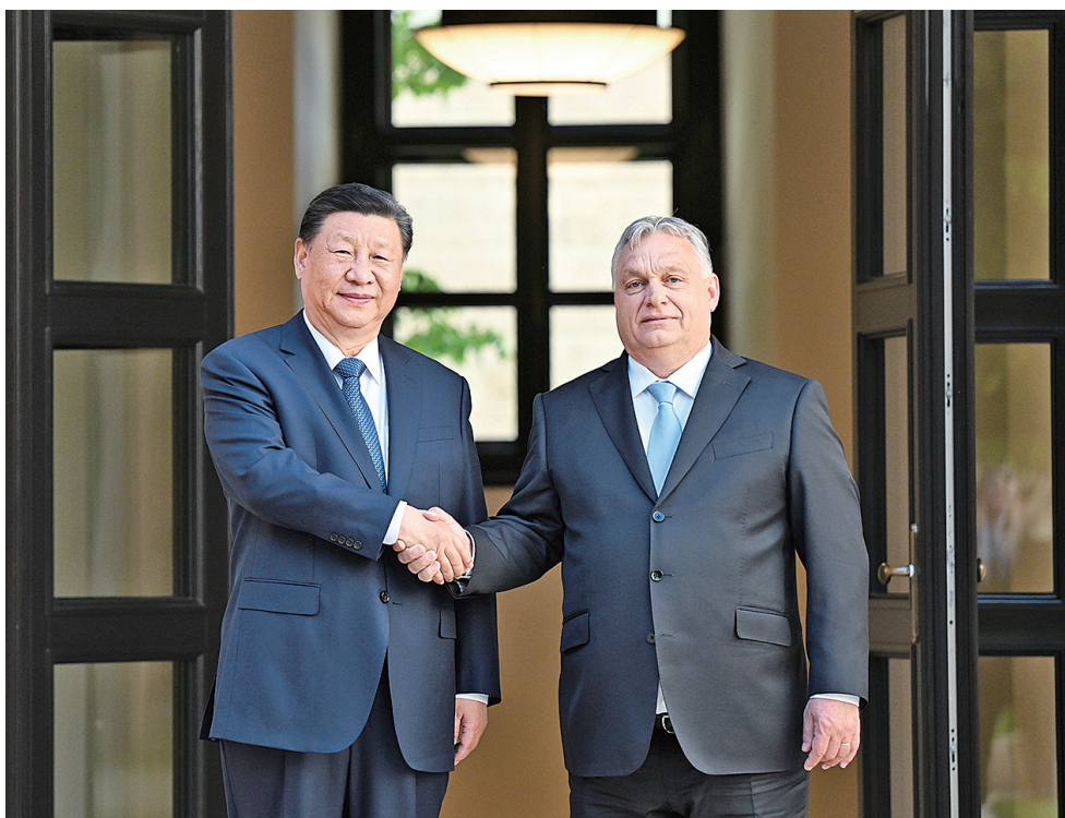
当地时间5月9日下午，国家主席习近平在布达佩斯总理府同匈牙利总理欧尔班举行会谈。

新华社布达佩斯5月9日电(记者韩墨 李超)当地时间5月9日上午，国家主席习近平在布达佩斯总统府同匈牙利总统舒尤克举行会谈。