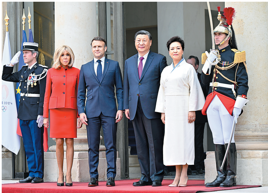
当地时间5月6日下午,国家主席习近平在巴黎爱丽舍宫同法国总统马克龙举行会谈。这是习近平和夫人彭丽媛同马克龙和夫人布丽吉特合影。新华社照片