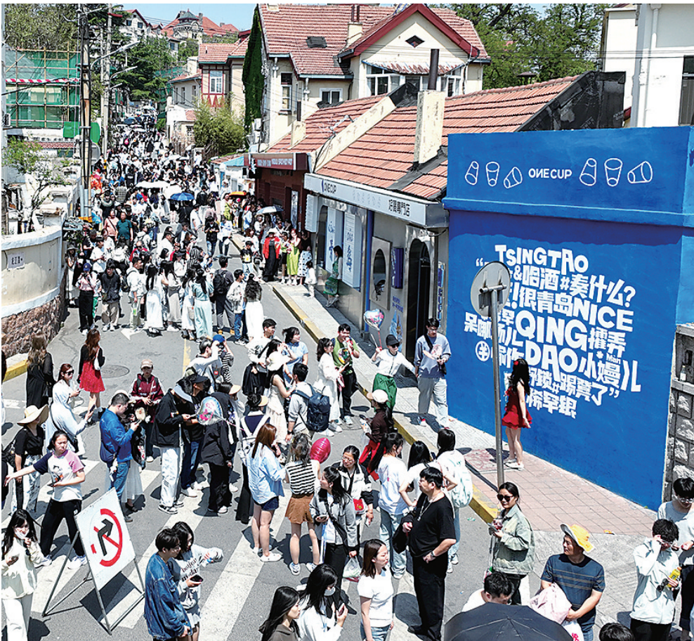
“五一”假期,老城区龙江路迎来大批游客。

值得一提的是,假期期间,身着黑色礼服的小提琴演奏者们“快闪式”现身历史城区街头、里院,婉转悠扬的旋律一经响起便吸引市民游客驻足欣赏。众所周知,青岛的别称为“琴岛”,如此温暖细心的设计,是这座“音乐之岛”独有的“浪漫”,也带给外地游客更多美好想象。