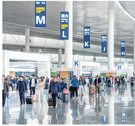
青岛机场航站楼内客流如织。