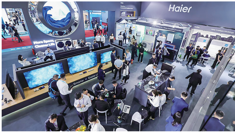
广交会上的海尔智家展台。

“这次来广交会真得不容易,从青岛直飞广州的航班或长时间晚点,或突然取消,团队不得不分批改签南昌、长沙等地,再乘火车到广州。”