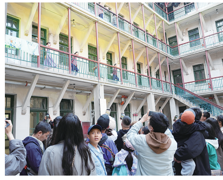
平康五里上演的舞剧《上街里的故事》吸引着游客驻足欣赏。