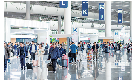
青岛机场航站楼内往来旅客川流不息。