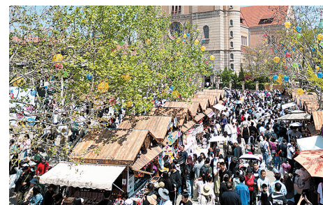
假日期间的海誓山盟广场迎来全国各地的游客。