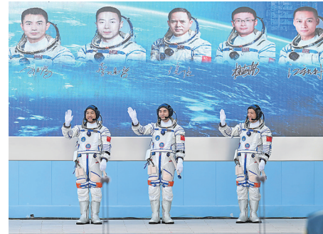
4月25日下午，神舟十八号载人飞行任务航天员乘组出征仪式在酒泉卫星发射中心问天阁圆梦园广场举行。这是航天员叶光富(中)、李聪(右)、李广苏在出征仪式上。