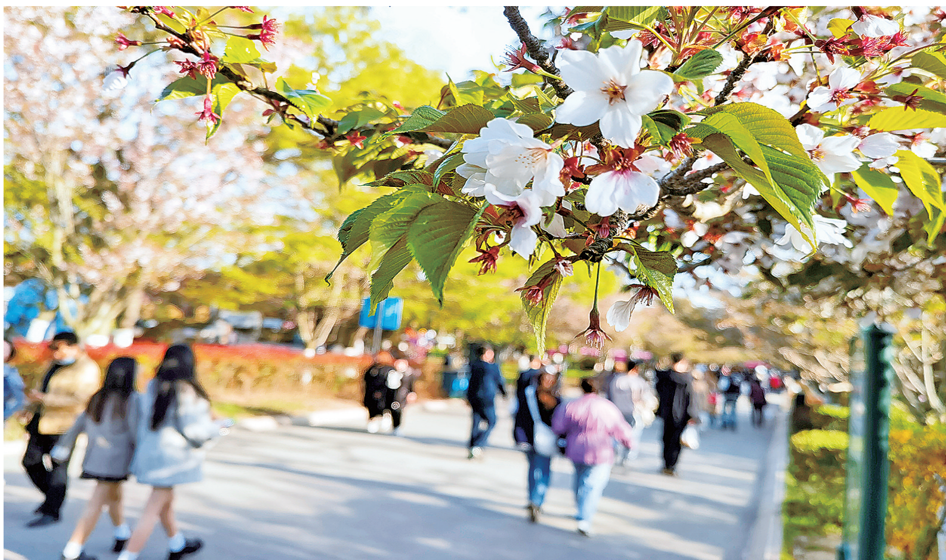
■去中山公园赏花是青岛网红打卡的保留项目之一。