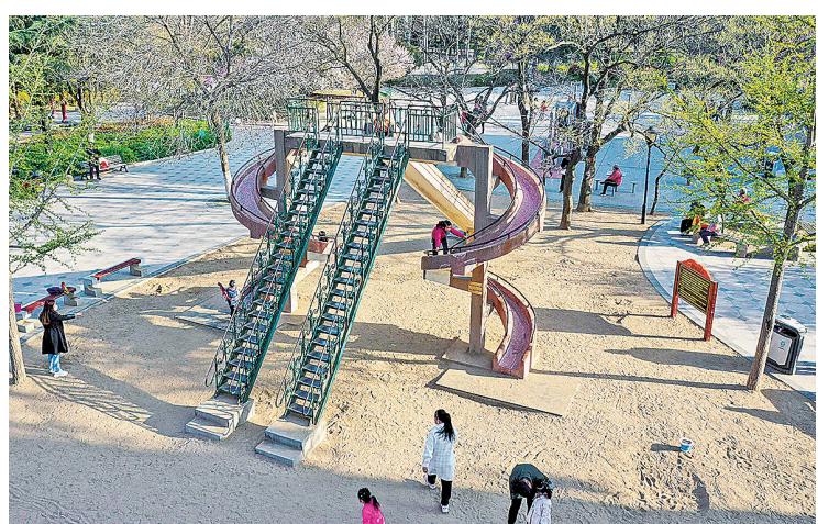
■沧口公园大滑梯因《你好旧时光》在此取景拍摄，成为网红打卡地。