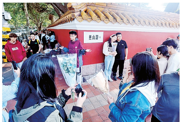
■大学路网红墙是年轻游客必到的打卡地之一。