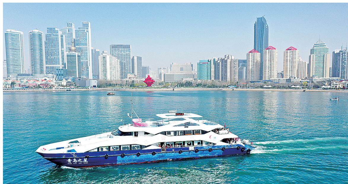
■市民游客乘坐海上樱花巴士打卡海上看青岛。