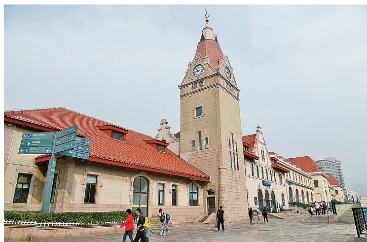
■青岛站是老城网红打卡路线的重要节点。