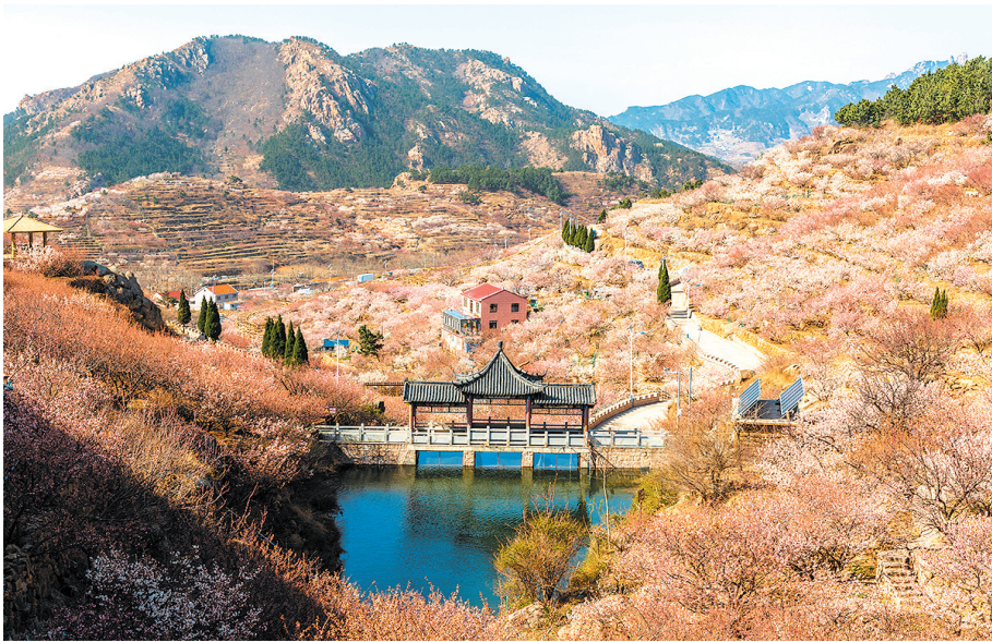
春日北宅，漫山遍野樱花盛开。