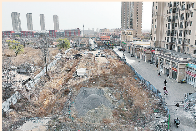
■平度市裕龙润邦小区北侧的长春路长期停工。