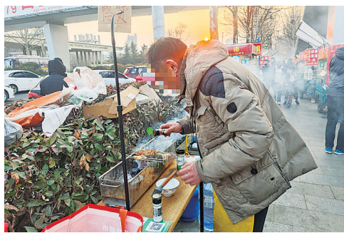
■青岛恒星科技学院南门外，摊贩在人行道上架起了烧烤炉。