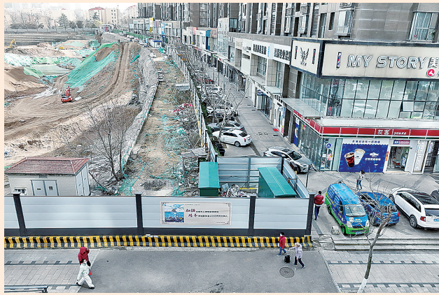
■市南区澄海路(燕儿岛路至汕头路段)尚未完工。