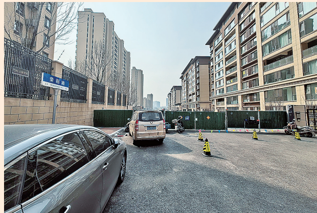
■城阳区荣阳路(良城路至泽城路段)被围挡封闭。