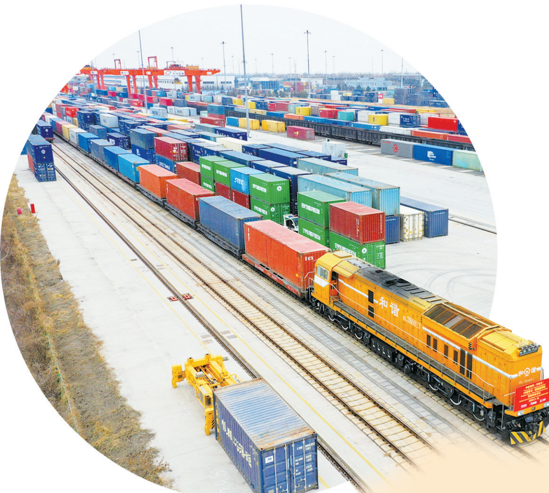
■从上合示范区多式联运中心开行的中欧班列。

市发展改革委相关负责人表示，2024年，青岛将力争服务业增加值突破1万亿元，生产性服务业增加值达到6400亿元，规上服务业经营主体超过3000户，185个重点建设项目完成年度投资600亿元以上，加快建设现代服务业标杆城市，有力支撑全市经济社会高质量发展。