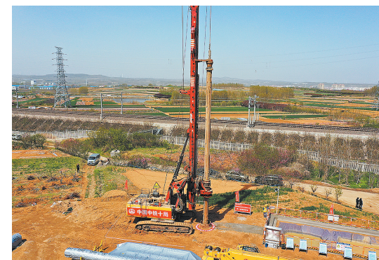
■潍宿高铁至青岛连接线项目沙河中村特大桥工点首桩开钻。