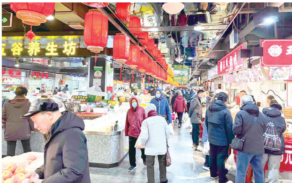
■规范化提升后的浮山所农贸市场，已成为周边社区的“邻里中心”。