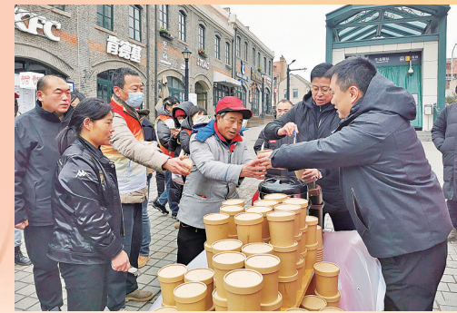
即墨路街道联合党建共建单位为来大鲍岛的市民和游客送暖粥。