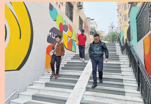
热河路44号-56号老旧楼院改造后的“琴键楼梯”。街道供图