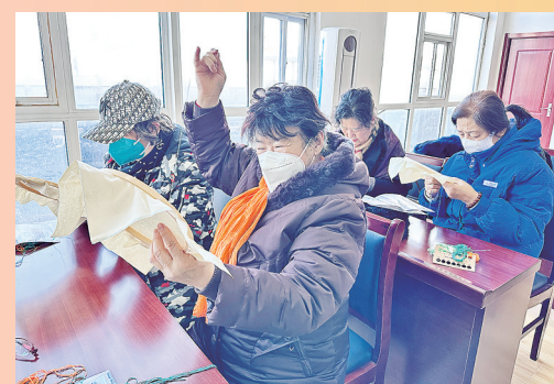
即墨路街道根据居民需求组织刺绣等公益课堂,受到居民欢迎。