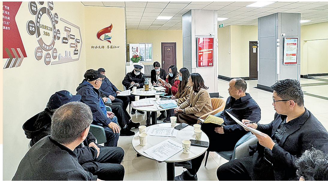
即墨路街道组织开展党群议事会,倾听群众心声。

今年以来,市北区即墨路街道锚定“社会治理提升年”目标,擦亮“即办先锋·墨蕴初心”党建品牌,拓宽“新航运·红里院”区域发展思路,以“五个一”体系积极探索党建引领社会治理新模式,通过用好党群议事会,打造楼宇党建共建阵地,成立大鲍岛红里院党支部等举措,努力实现“政治、自治、法治、德治、智治、美治”六治融合,全力推进城市更新、产业焕新,不断提升群众获得感、幸福感、安全感。