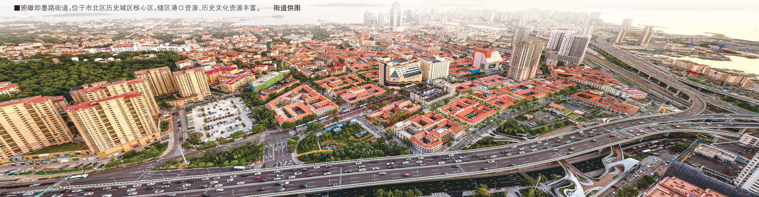
俯瞰即墨路街道,位于市北区历史城区核心区,辖区港口资源、历史文化资源丰富。