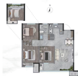
▲龙湖·龙誉城|揽境 户型图

建面约94-130平方米山湖巨幕好房，集萃跑道式阳台、北向灵动空间、全系LDKB一体