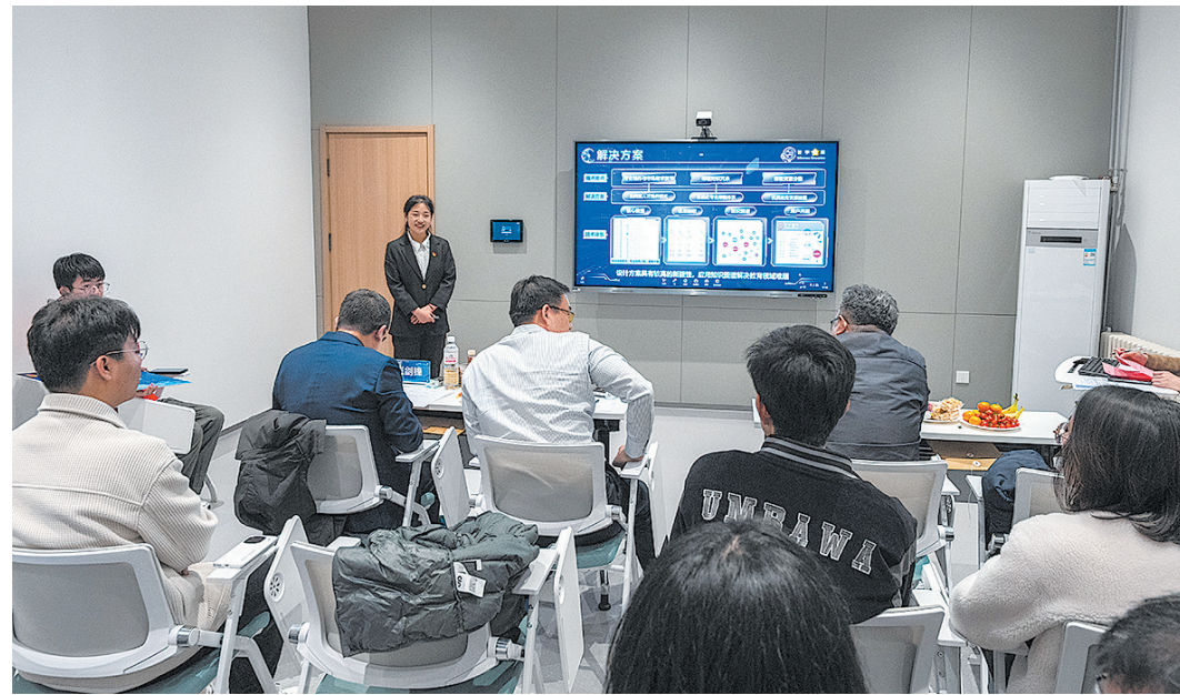
■中国石油大学(华东)举行第十四届“挑战杯”大学生创业计划竞赛校赛。郝春强 摄

整体位居全国高校前列。中国石油大学(华东)参赛团队在中国国际大学生创新大赛(2023)斩获金奖2项、银奖7项、铜奖3项，国奖数量创历史新高。机器人是山东科技大学的传统优势项目，2023年，该校在全国大学生机器人大赛(RoboMaster机甲大师赛)、全国大学生机器人大赛(ROBOCON赛事)中均取得了不错的成绩。