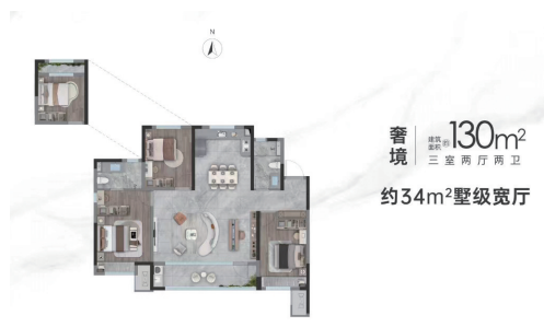
▲龙湖·龙誉城|揽境户型图