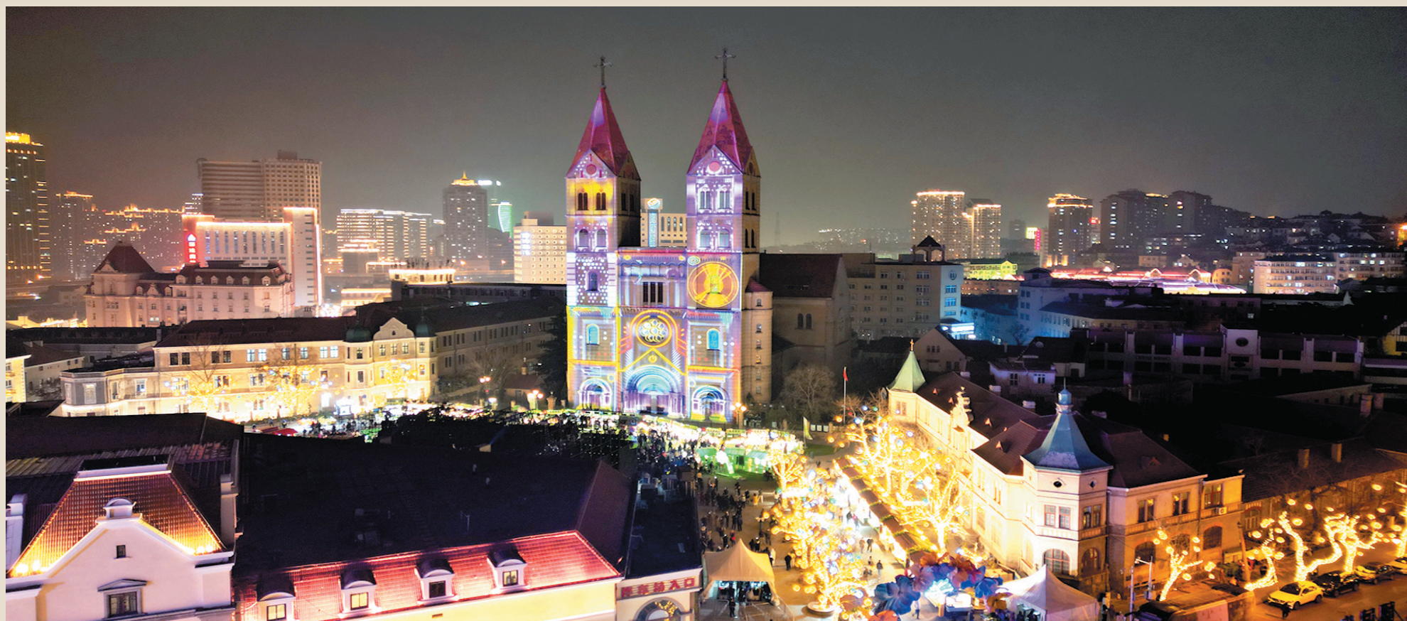
■圣弥厄尔大教堂在光绘中跳跃时代脉动。