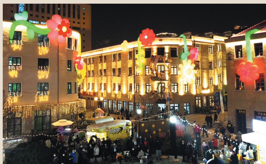
■入夜后的大鲍岛文化休闲街区灯火璀璨。