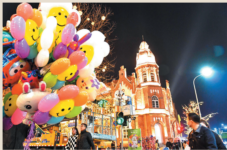
■百年韵味的中山路夜色迷人。