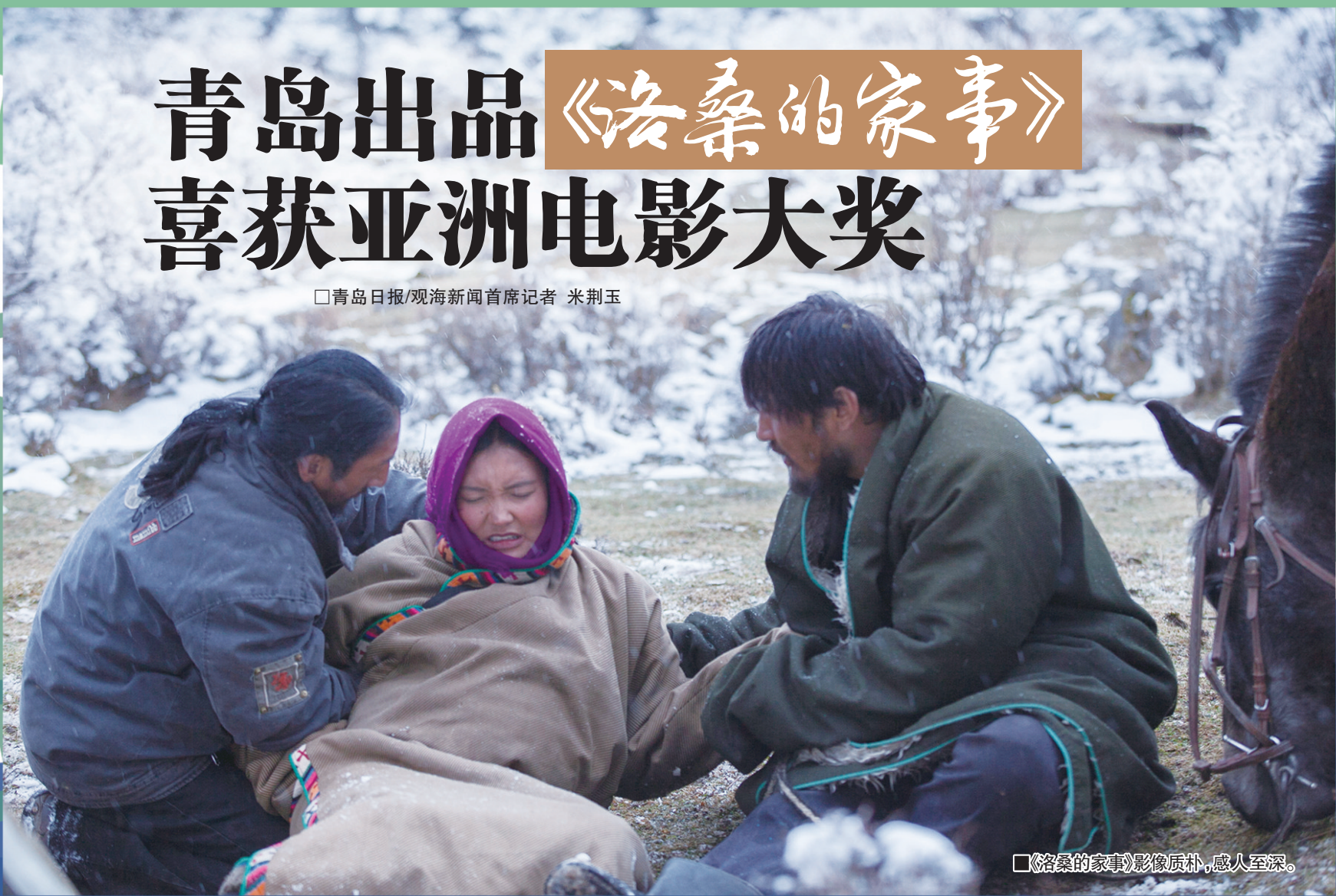
《洛桑的家事》影像质朴，感人至深。

电影《洛桑的家事》日前喜提捷报：11月20日在菲律宾揭幕的全亚洲独立电影节上，该片荣获故事片单元最佳影片奖，为“青岛出品”电影再添新荣誉。这部电影由青岛橙禾影视、山东迦望文化传媒出品，是中宣部电影精品专项资金资助项目。