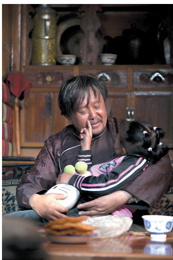
藏族演员本色出演《洛桑的家事》。