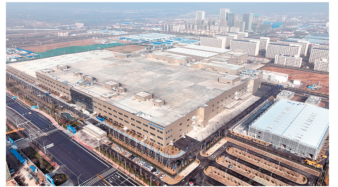
■青岛京东方光电科技有限公司。

京东方物联网移动显示端口器件生产基地项目产品点亮,满产后可年产中小尺寸液晶显示模