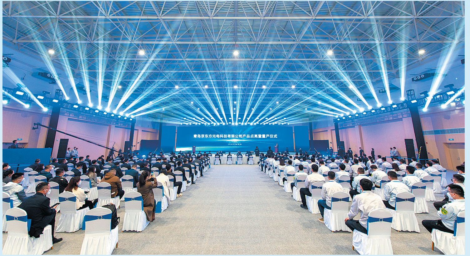
■青岛京东方光电科技有限公司产品点亮暨量产仪式现场。

强化对园区的政策支持和要素保障,主动靠前提供一流服务;与链主企业、龙头企业携手推动更多上下游企业集聚,凝聚园区发展合力。在这套明确的打法之下,核心项目建设频频刷新速度,配套项目招引频频新亮点,园区规划推进取得新进展,青岛正在加速塑造千亿级“芯屏经济”。