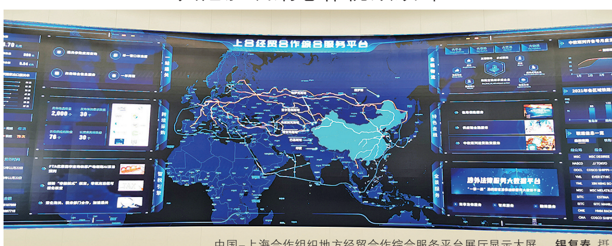
中国-上海合作组织地方经贸合作综合服务平台展厅显示大屏。

青岛日报/观海新闻记者 锡复春 通讯员 李颖慧 本报11月25日讯 今天下午,国内首个面向上合组织国家地方经贸领域的一站式公共服务平台——中国-上海合作组织地方经贸合作综合服务平台(简称“上合经贸综服平台”)上线启用仪式在青岛·上合之珠国际博览中心举行,该平台依托中国国际贸易“单一窗口”,打造中国与上合组织国家间经贸资讯服务中心和数据交互中心,为上合组织国家间经贸开放融通提供示范方案。启用仪式后,上合组织贸易