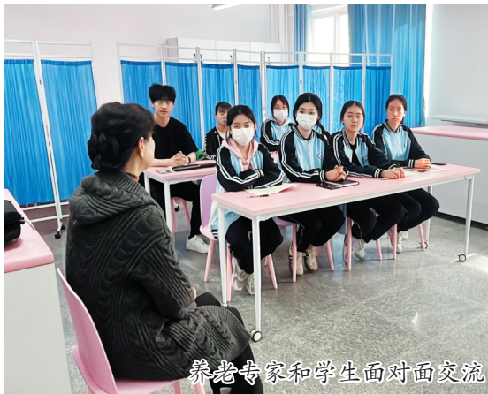
养老专家和学生面对面交流

青岛目前有7000多名养老护理人员,但普遍存在年龄偏大、缺乏专业护理技能等问题。着眼于这一现实需求,近日,青岛市民政局等11部门联合印发《关于加强养老服务人才队伍建设的若干措施》,支持驻青高等院校和职业院校(含技工院校)设立养老服务相关专业。